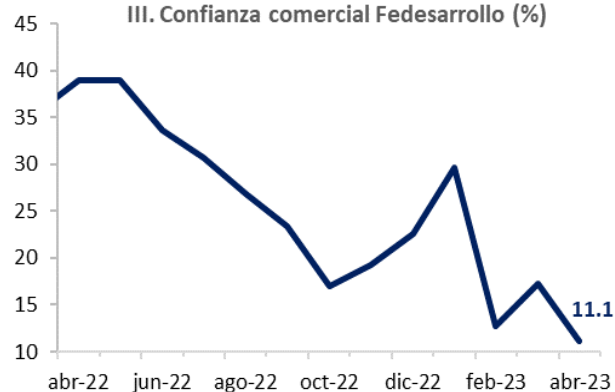
III. Confianza comercial Fedesarrollo (%)